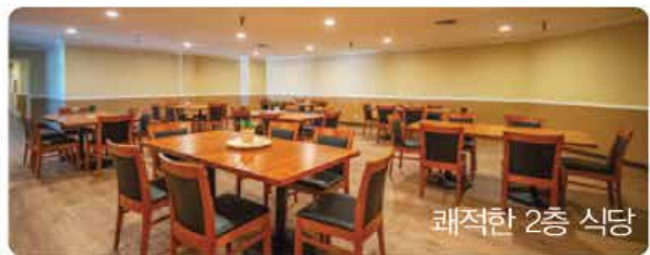
쾌적한 2층 식당