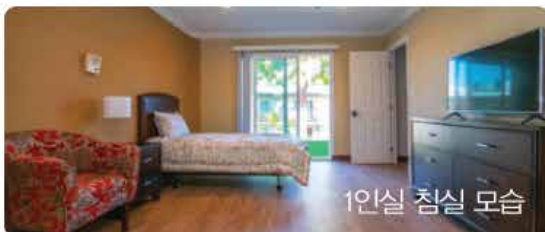
1인실 침실 모습

• 홈 헬스 • 호스피스 • 양로보건센터 서비스 • 외출시 교통편 예약 대기 서비스