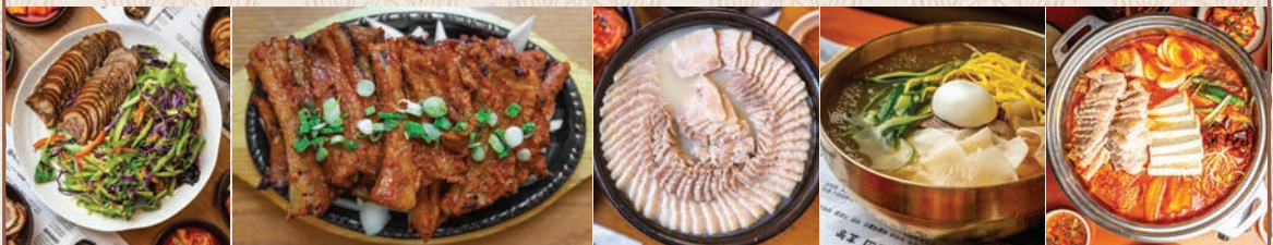
냉채 족발 Naengchae Jokbal