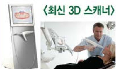
〈최신 3D 스캐너〉

치과처리가 두려우신 분 미소마취로 편안한 진료 받으세요! Laughing gas + Nitrous Oxide