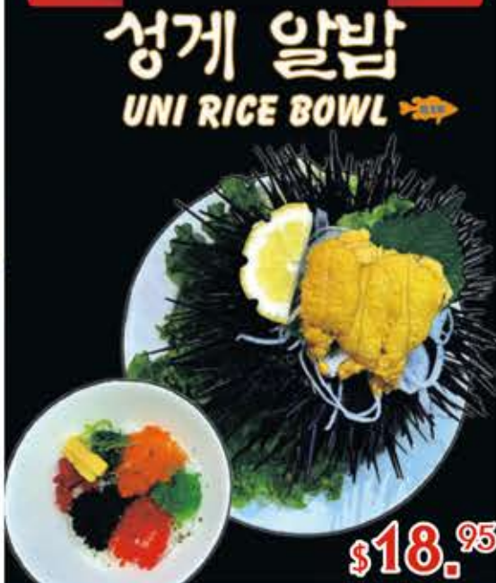
성게 알밥 UNI RICE BOWL