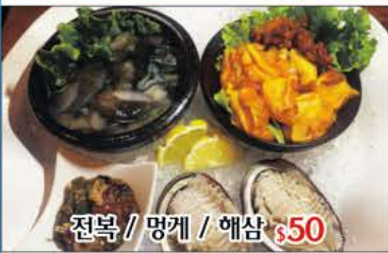
전복 / 멍게 / 해삼 $50