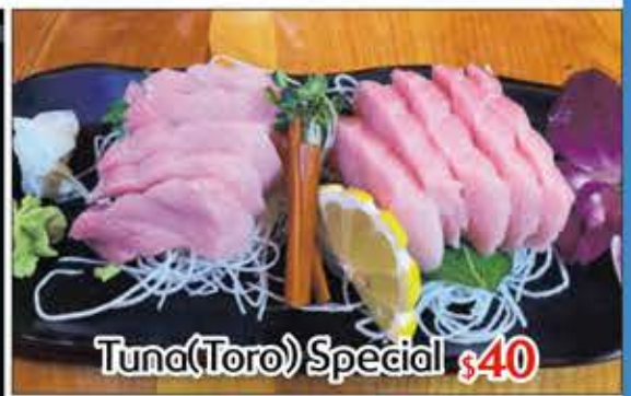
Tuna(Toro) Special $40