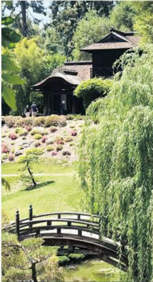
▲ Huntington Library Japanese Garden

Desert Garden, Lily Ponds, Jungle Garden & Palm Garden, Chinese Garden, Japanese Garden 등이 널리 알려져 있으며 특히 Japanese Garden은 가장 인기 있는 장소 중 하나로 1904년 일본에서 만들어 보낸 일본식 주택 건물이 일본의 정취를 물씬 풍겨주는 곳이다. 1968