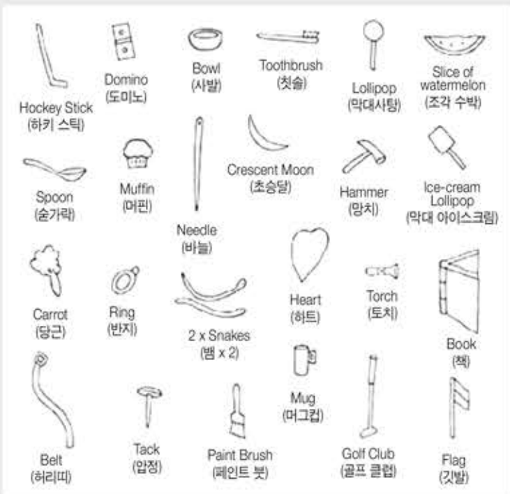
■ 이미지 출처: mungfali.com