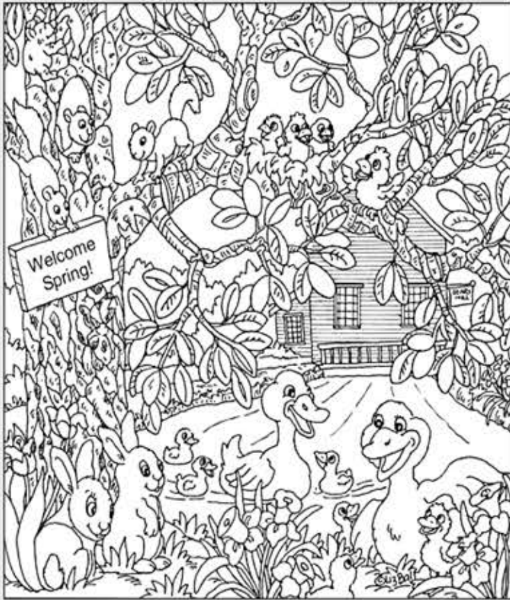
© 위의 그림에 숨어있는 아래 그림을 찾으며 영어 단어도 익혀 보세요. (해답은 P50에 있습니다.)