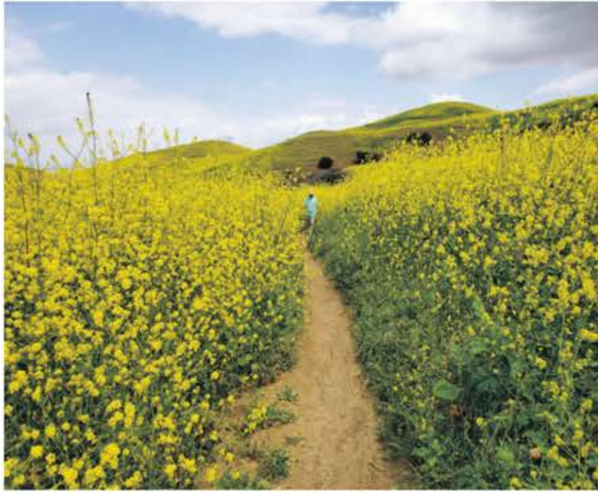
▲ 온통 노란 꽃으로 물든 San Juan Hill 풍경.

트레일 헤드에서 편도 2.9 마일 왕복 5.8마일로 길 따라 걷는다. 고도가 높지 않고 평평한 길이 아주 잘 만들어져 있어 남녀노소 누구나 쉽게 걸을 수 있는 곳으로 가족들이 함께 다녀오기를 권한다. 이곳은 4월이면 온통 노란 꽃으로 물든다. 산들바람 따라 춤추는 노란 꽃물결을 바라보면 그 모습에 취해 한 동안 멈춰서 있지 않을 수 없다. 일반적으로 4월 말에서 5월초 정점에 달한다. 주변의 작은 구름들이 모두 노랗게 물들어 그야말로 꽃길만 걸을 수 있다. 함께 걸었던 친구는 이 좋은 곳을 많은 사람들에게 보여주고 싶다고 수차례 말했다.