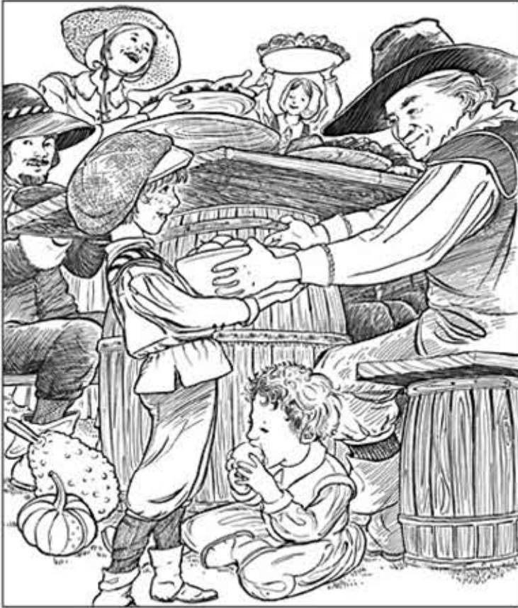
© 위의 그림에 숨어있는 아래 그림을 찾으려 영어 단어도 익혀 보세요. (해답은 P53에 있습니다.)