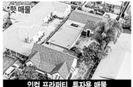
인컴 프라퍼티, 투자용 매물 싱글홀 뒷채는 주인이 사셔도 되는 단층집

예쁜 단층집, 로즈 크랜과 길벗 위치 학교 좋은 동네, 한인분들 아주 선호하시는 플러튼 meadow, 단지 내 수영장, 놀이터, 농구장.