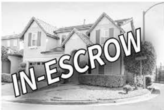
부에나파크 싱글홀 $1,295,000

Residence Plan 6 - 단층 구조 방 2개 화 2개 1104 sqft Residence 5 - 3 bed, 2.5 bath, 1,407 sq. ft. tri-level Residence 79 - 3 bed, 3.5 bath, 1,717 sq. ft. Deck, porch, 2-car side-by-side garage Plan 2C - 2 bed, 2.5 bath, 1,352 sq. ft. Large Deck, porch, walk-in pantry 2-car side-by-side garage