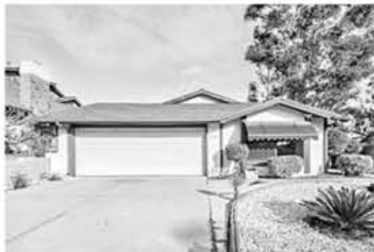
플러튼 싱글 단층집 $1,120,000

아랫층 방 하나 욕실함 있음, 집전체 마루! 쾌적한 주변 환경, 편리한 위치 안전한 게이트 단지내, 수영장, 농구코트, 놀이터