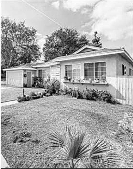
부에나파크 단층집 + 추가 인컴 수입 이중집 $1,365,000

대지 8591 sqft, 앞채 방 3개 화 2개 이중집 방 2 화 1.5 렌트비 3700, 2500= 6200.