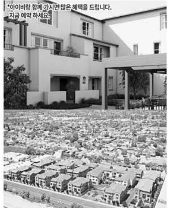
새집 분양 라하브라 게이트 단지

방 3 화 1.75, 1950 sqft, 대지 13072 sqft, 1967년 아주 큰 마스터 베드룸 엑스트라 라지 사이즈 클로젯, 수영장 집 전체 방수 마루 바닥, 시티와 눈 덮인 산이 보이는 전망 좋은 단층집 부에나파크 한인타운에서 10분 거리입니다. 지금 전화 주세요.