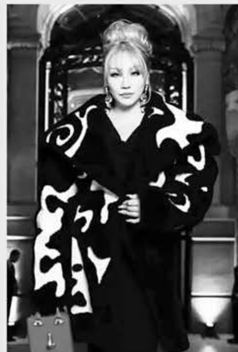
▲ 가수 씨엘, 사진=케이팝핑

가수 씨엘(CL)이 K팝 가수로는 처음으로 세계 최대 패션 시상식 '2024 LVMH 프라이즈' (2024 LVMH Prize)의 심사위원으로 합류했다.