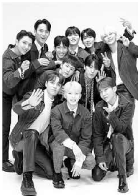
▲ 그룹 세븐틴, 사진=플레디스엔터테인먼트

톱 10에는 스트레이 키즈의 '★★★★' (파이브스타·2위), '락스타' (樂-STAR·9위), NCT 드림의 'ISTJ' (6위)등의 한국 가수 앨범도 이름을 올렸다.