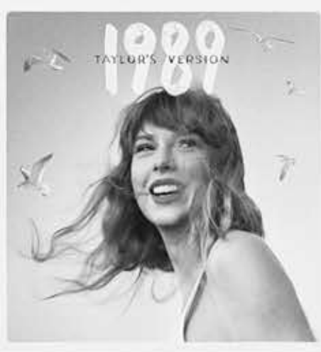
▲ 스위프트 앨범 '1989(Taylor's Version)' 커버 이미지

스위프트는 3월2일 자 빌보드 메인 앨범차트 '빌보드 200' 톱10 성적으로 비틀스가 '빌보드 200' 톱10에서 갖고 있던 주간 진입 기록을 경신했다.