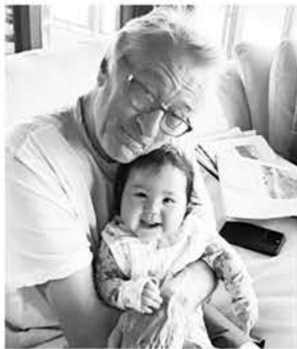
▲ 로버트 드니로가 늦둥이 딸을 품에 안고 있다.

드니로는 “그렇게 해서 손자의 죽음을 막을 수 있었을지는 모르겠다” 면서도 “그런 일은 일어나지 말았어야