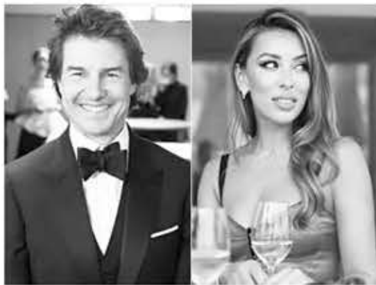
▲ 톰 크루즈왼쪽과 엘시나 카이로바.

이들은 함께 사진에 찍히지 않기 위해 많은 주의를 기울였지만 지난해 12월 영국 런던에서 열린 자선단체 후원 행사에 같이 참석한 모습과 카이로바의 자택 인근의