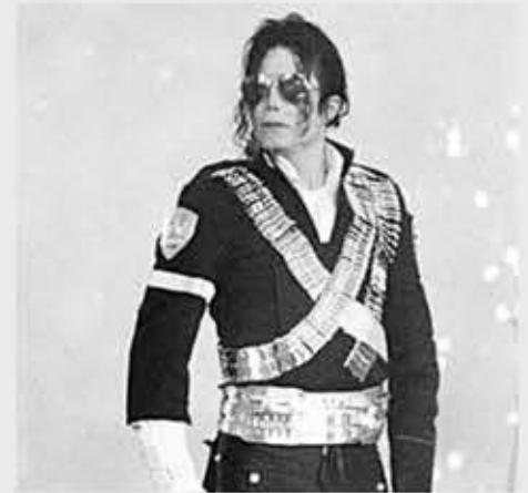
▲ 생전 무대에서 공연 중인 마이클 잭슨

미국의 소니뮤직그룹이 전설적인 팝스타 마이클 잭슨의 음반 및 작곡 저작권의 절반을 최소 6억달러사들이는 계약을 체결했다.