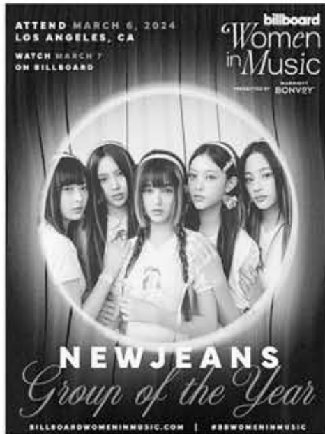
▲ 뉴진스의 '2024 빌보드 위민 인 뮤직 어워즈' 출연 홍보 이미지

도 '올해의 여성' (Woman of the Year)에 이름을 올린 카를 G클비 롯데 찰리 XCX, 마렌 모리스, 템 스 등이 공연한다.