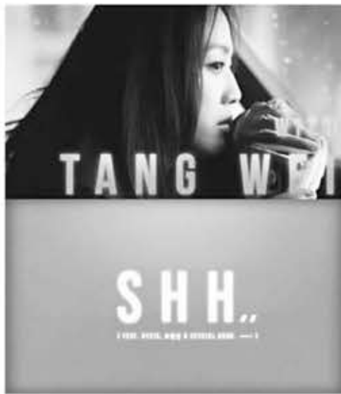
▲ 탕웨이가 출연한 아이유의 신곡 'Shh..' 뮤직비디오 티저 이미지

탕웨이는 출연 이유로 "아티스트 아이유를 좋아해서"라며 "저 역시 다른 분들처럼 아이유의 재능, 성격, 노래를 좋아한다"고 전했다.