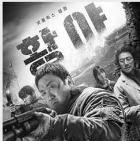
▲ 영화 '황야' 포스터.

마동석이 괴력의 사냥꾼으로 변신한 영화 '황야'와 연상호 감독이 각본을 쓴 미스터리 스릴러 드라마 '선산'이 글로벌 팬들의 마음을 사로잡았다.