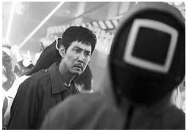
▲ '오징어 게임' 시즌2 스틸컷.