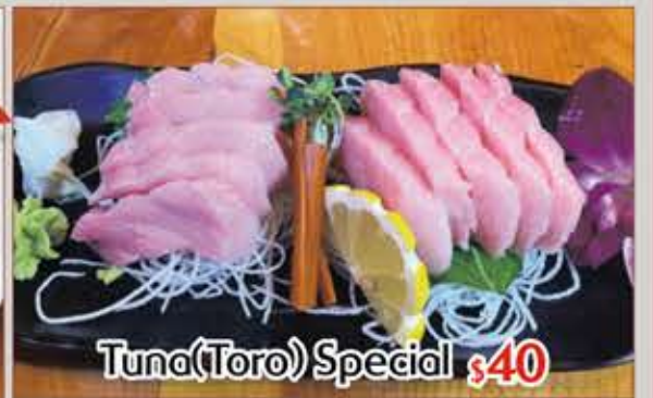
Tuna(Toro) Special $40