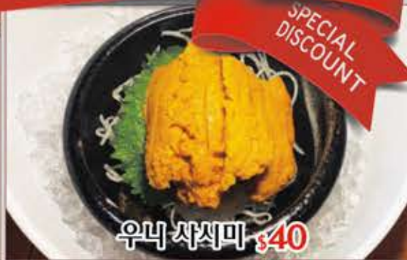
우니 사시미 $40