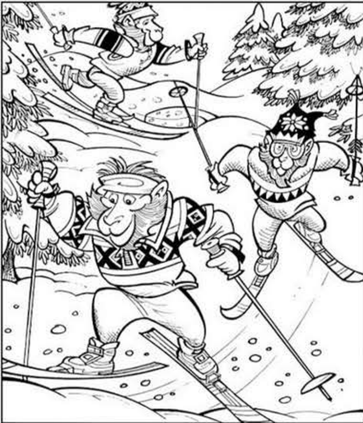
◎ 위의 그림에 숨어있는 아래 그림을 찾으려 영어 단어도 익혀 보세요. (해답은 P53에 있습니다.)