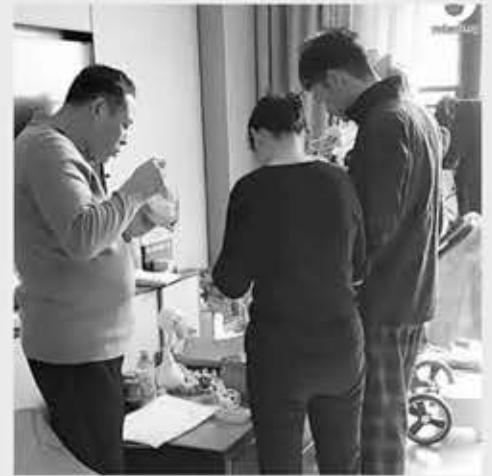
▲ 230일 넘게 호텔 스위트룸에서 생활 중인 가족들.

중국의 한 가족이 고급 호텔 스위트룸에 영구 입주해서 살고 있어 누리꾼들 사이에서 비난과 부러움을 동시에 받고 있다. 이 가족은 집을 임대하거나 소유하는 것보다 이 방법이 더 저렴하고 편리하다고 말했다.