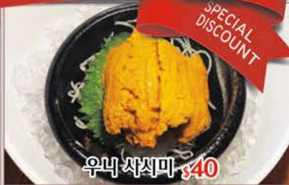
우니 사시미 $40