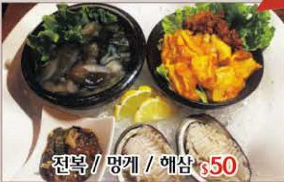
전복 / 멩게 / 해삼 $50