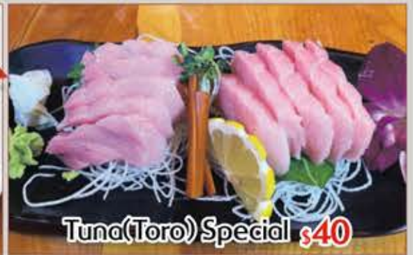
Tuna(Toro) Special $40