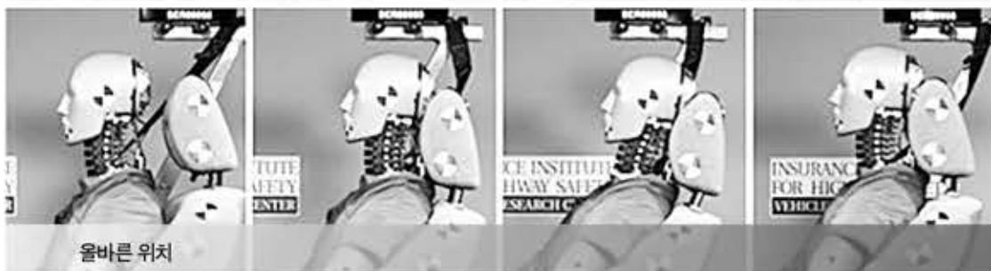
▲ 차량 추돌 시 헤드 레스트 위치에 따른 인체 충격 실험 모습.