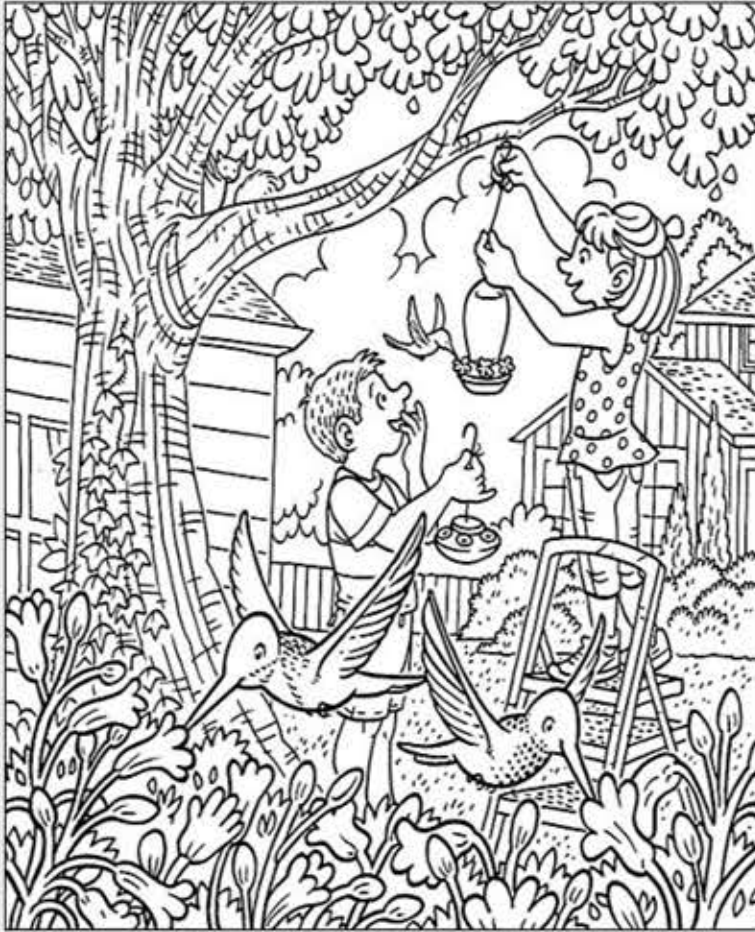
© 위의 그림에 숨어있는 아래 그림을 찾으려 영어 단어도 익혀 보세요. (해답은 P51에 있습니다.)