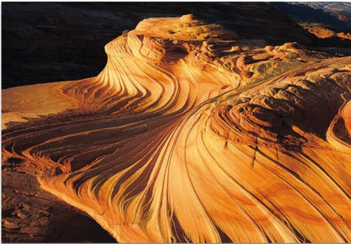
세컨드 웨이브의 선셋

해마다 12월 중순이 다가 오면 생각나는 출사 장소가 여러 곳 있는데, 그 중에 가장 먼저 떠오르는 곳은 유타와 아리조나 보더라인에 걸쳐 있는 코요테 뷰트 노스 (Coyote Butte North)의 웨이브 캐년이다. 왕복 약 8마일 정도 하이킹하면서 웨이브 캐년으로 가다 보면 경이로운 풍경이 눈앞에 쩍아 펼쳐진다. 카메라를 들이대기만 하면 작품이 자연스럽게 나온다. 수없이 많은 사진 스팟 중에서도 특히, 12월과 1월에 보는 세컨드 웨이브의 선셋 풍경을 개인적으로 가장 좋아한다. 12월 중순부터 1월 중순까지 해가 지면서 비추는 세컨드 웨이브는 끝없는 2-3분 동안에 더욱 아름답고 황홀하게 보여진다.