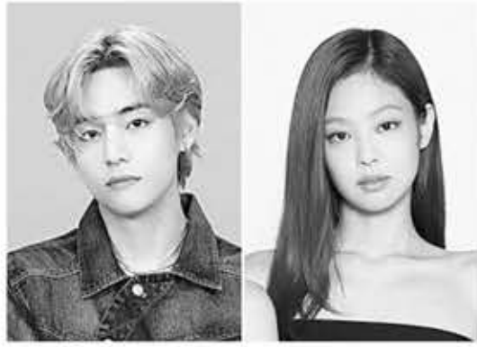
▲ BTS 뷔(왼쪽)와 블랙핑크 제니.

6월 한 매체는 입대를 앞둔 뷔와 제니가 최근 연인 사이를 정리했다고 보도했다. 이와 관련해 양측 소속사는 말을 아끼고 있다.