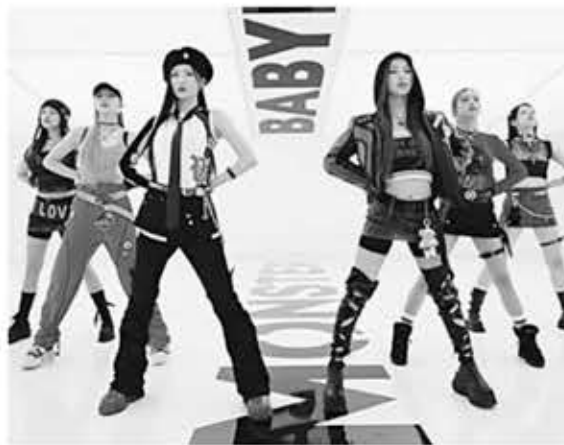
▲ 베이비몬스터 ‘배러업’ 뮤직비디오. 사진=YG엔터테인먼트

5일 빌보드가 발표한 최신 차트에 따르면 베이비몬스터 데뷔 디지털 싱글 ‘BATTER UP’은 빌보드 글로벌 200과 빌보드 글로벌(Billboard Global Excl. U.S)차트서 각각 101위, 49위로 진입했다.