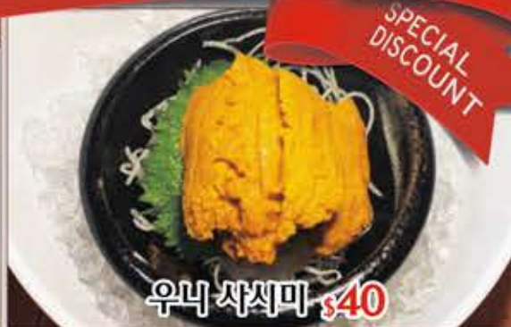
우니 사시미 $40