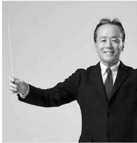
▲ 지휘자 금난새