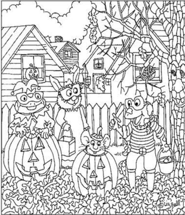
© 위의 그림에 숨어있는 아래 그림을 찾으며 영어 단어도 익혀 보세요. (해답은 P51에 있습니다.)