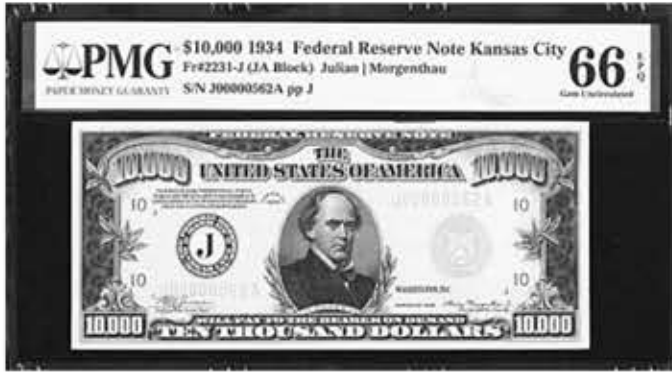
▲ 1934년 발행된 1만 달러 지폐.

세계 대공황 시절에 발행된 희귀한 1만 달러 지폐가 경매에서 50배에 가까운 가격에 팔렸다.