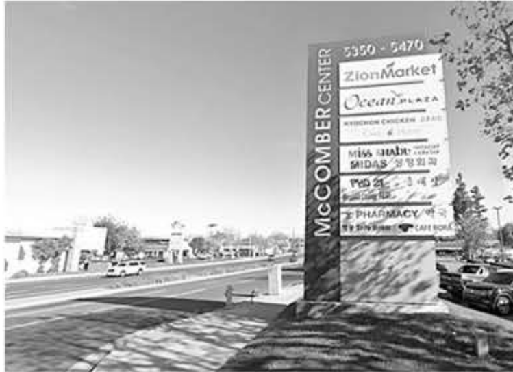
▲ 부에나파크 코리아타운으로 지정된 비치블러바드와 알람베뉴 교차로 인근 모습.

부에나파크 시의회는 또 코리아타운으로 지정된 구간 가운데 비치 블러바드와 오렌지소프 애비뉴, 커먼웰스 애비뉴, 아테시아 블러바드, 델번 애비뉴(서쪽은 라미라다 블러바드), 로즈크랜스 애비뉴가 만나는 5개 교차로에는 코리아타운 표지판을 제작해 세계 한인 비즈니스대회(구 한상대회) 개막일인 10월 11일 이전에 설치하기로 했다. 세계 한인 비즈니스