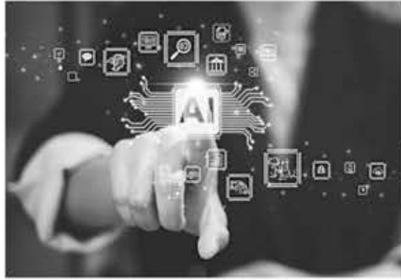
▲ AI 분야에 관심이 있다면 컴퓨터 과학, 수학, 통계학 과목을 수강하는 것부터 시작하는 것이 중요하다.

* Machine learning: 알고리즘의 개발과 적용에 초점을 맞춘 보다 전문화된 전공이다. 머신러닝은 AI의 핵심 기