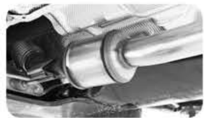
촉매 변환기가 정상적으로 작동하지

산소 센서나 MAF(Mass Air Flow)라고 하는 공기 질량 센서 등 각종 센서에 이상이 생겼을 때도 엔진경고등이 켜진다. 산소 센서는 기름이 잘 연소하고 있는지에 대한 정보를 수집하는 역할을 한다.