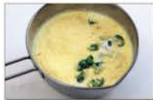
2. 크림소스재료 분량대로 생크림, 우유, 파르미산 치즈가루, 송송썬 청양고추를 넣고 고루 섞는다.