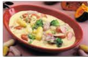
6. 완성 그릇에 담아 주면 크림소스의 진한 맛이 살아 있는 까르보나라떡볶이 완성.