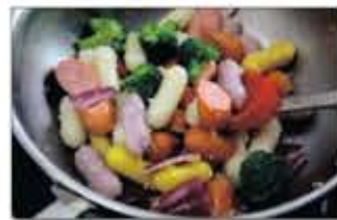
3. 중약불로 달군 팬에 올리브유를 두르고, 다진 마늘과 양파를 넣고 볶다가 치즈떡과 비엔나 소시지, 브로콜리를 넣고 1분간 더 볶는다.