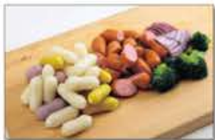
1. 치즈떡은 한 번 행귀 물기를 빼서 준비하고, 비엔나 소시지는 먹기 좋게 2등분 하고, 양파는 2x2cm 크기로 썰고, 브로콜리도 먹기 좋게 썬다.

◆ 주재료: 치즈떡(300g), 비엔나 소시지(10개), 양파(4분의 1개-50g), 브로콜리(1줄-50g), 체다슬라이스치즈(1장) ◆ 크림소스 재료: 생크림(1컵), 우유(1컵), 파르미산 치즈가루(2), 청양고추(1개) ◆ 양념재료: 올리브유(1), 다진 마늘(1), 소금(0.2), 통후추 간 것(적당량)