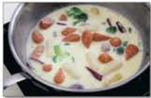
4. 미리 만들어 놓은 크림소스를 붓고, 불의 세기를 세게 하여 바글바글 끓기 시작하면 중불로 줄여 3-4분간 떡이 푹 익을 때까지 더 끓인다.