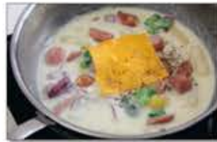
5. 떡이 알랑하게 익으면 체다슬라이스 치즈를 넣고 맛을 보아 소금, 통후추 간 것을 넣어 주면 끝!