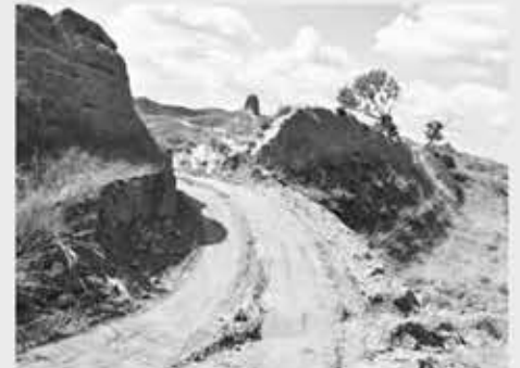
▲ 만리장성의 일부 구간을 굴착기로 파손한 황당한 일이 발생했다.