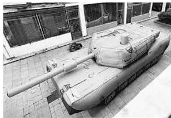
▲ 우크라이나 군이 사용하는 것으로 추정되는 목재와 천으로 만들어진 체코제 미끼 탱크.

공장 작업자들은 우크라이나군으로부터 암호화된 메시지로 주문 요청을 받아 해당 무기와 관련된 이미지를 구글에서 찾고, 제작에 적합한 재질을 선정한 후, 버려진 목재와 오래된 트럼통까지 사용 가능한 재료로 가짜 무기 부품을 생산한다. 완성된 부품들은 최전선으로 운송