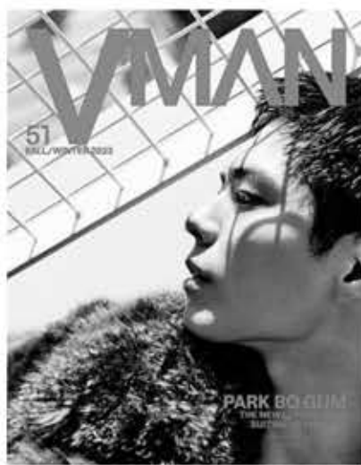
▲박보검이 장식한 VMAN 커버, 사진=VMAN

브이맨은 미국 유명 여성 패션지인 브이 매거진(VMAGAZINE)에서 연 2회 시즌별로 발행되는 인기 남성 패션지로, 박보검은 브이맨의 2023년 가을/겨울호 커버(표지)를 장식했다.