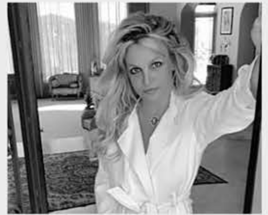
▲브리트니 스피어스

최근 세번째 남편과 이혼한 미국 팝스타 브리트니 스피어스(41)가 열애설에 휩싸였다.