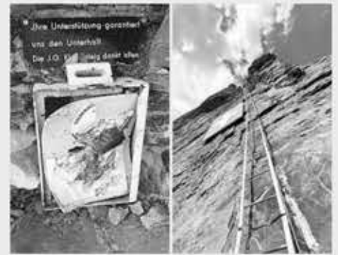
▲ 완전히 찌그러진 채 발견된 모금함(왼쪽). 모금함이 있는 장소에 도달하기 위해 등반해야 하는 사다리.