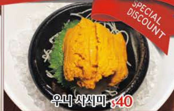
우니 사시미 $40