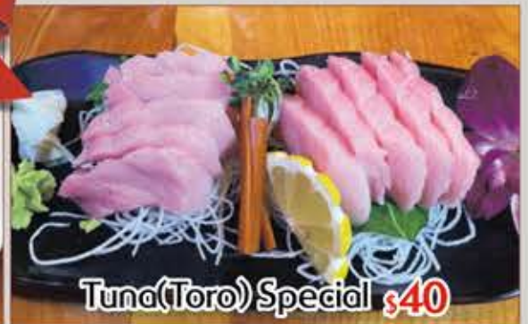
Tuna(Toro) Special $40