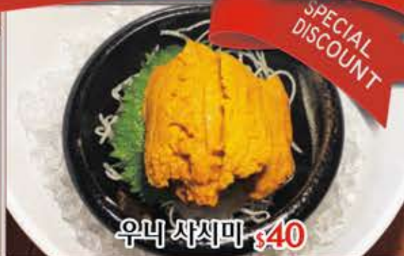
우니 사시미 $40