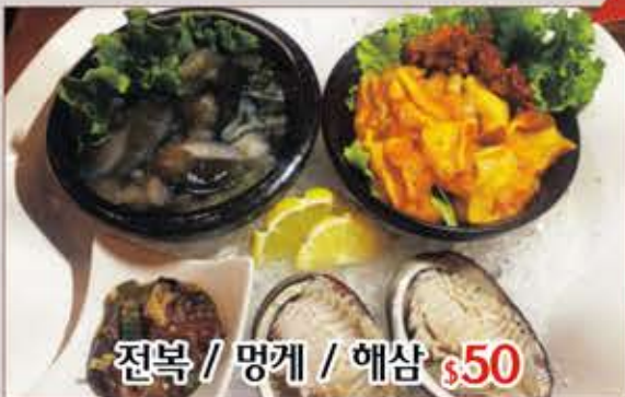
전복 / 멍게 / 해삼 $50