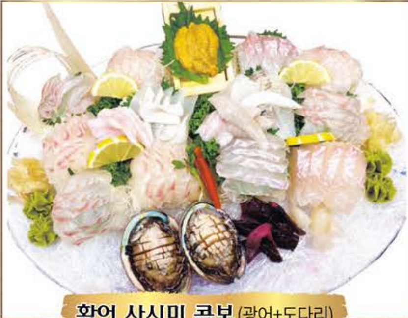
활어 사시미 콤보 (광어+도다리)