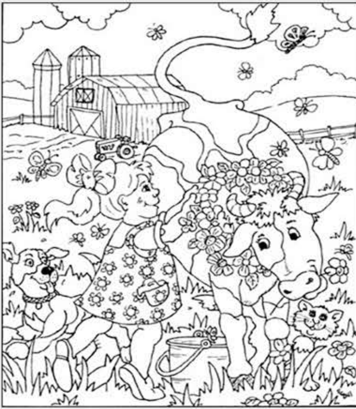
◎ 위의 그림에 숨어있는 아래 그림을 찾으려 영어 단어도 익혀 보세요. (해답은 P59에 있습니다)