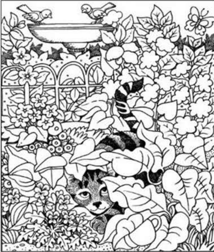
© 위의 그림에 숨어있는 아래 그림을 찾으며 영어 단어도 익혀 보세요. (해답은 P59에 있습니다.)