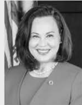
▲ 태미 김 어바인 부시장.

내년 11월 열리는 어바인 시장 선거에 출마하는 태미 김 현 어바인 부시장 이 선거자금 모금에서 경쟁 후보를 압도하고 있다.