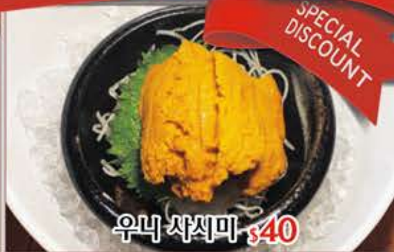
우니 사시미 $40