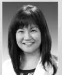
Dr. 백사론 한의원, 척추신경의사 SCU 척추 외대 졸업 South Baylo 한의대 졸업

9681 Garden Grove Bl., Suite 101 Garden Grove, CA 92844(모란각 식당 옆)