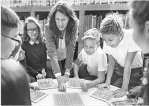
▲ 학생들이 수업 중 선생님의 설명을 듣고 있다.

미국 학생들이 코로나 이전 수준의 학습 능력을 회복하지 못했으며 흑인과 히스패닉 학생들이 팬데믹으로 가장 큰 타격을 받은 것으로 나타났다.