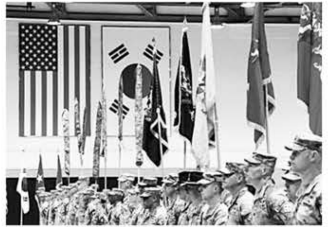
▲ 지난 6일 경기 동두천시 캠프 케이시에서 미2사단·한미연합사단 순환배치 부대 임무 교대식이 열리고 있다.

내로 한반도의 전시작전통제권 이양 문제에 대해 의회에 보고하도록 했다. 보고서에는 한국군이 한미연합사령부의 전작권을 인수할 준비가 되기 위해 충족해야 하는 조건을 설명하고, 한국군이 조건을 어느 정도로 달성했는지 평가하라고 했다.