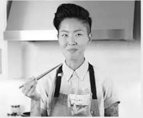
▲ 크리스틴 키시

미국으로 입양돼 요리사로 성공한 한국계 크리스틴 키시가 인기 요리 프로그램 ‘톱 셰프’ (Top Chef) 시즌 21의 진행자로 발탁돼 관심을 모으고 있다.