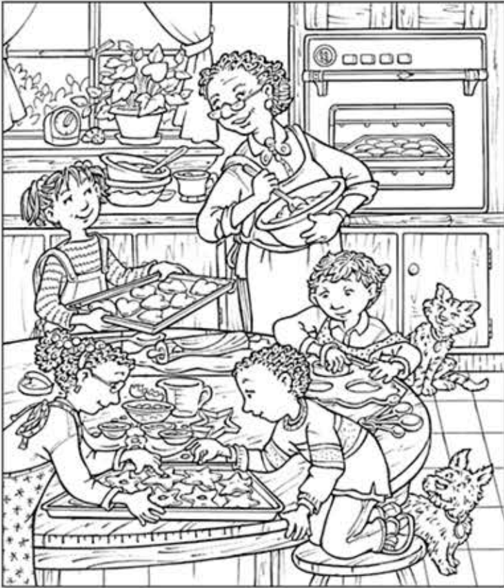
© 위의 그림에 숨어있는 아래 그림을 찾으며 영어 단어도 익혀 보세요. (해답은 P53에 있습니다.)