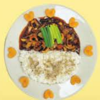
컵밥(오징어, 불고기, 치킨, 김치)

김치, 깍두기, 나박김치 맛은 어디서도 비교할 수 없는 맛을 자부합니다. *