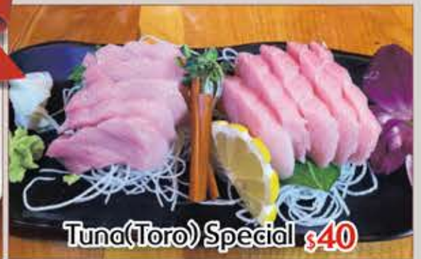
Tuna(Toro) Special $40