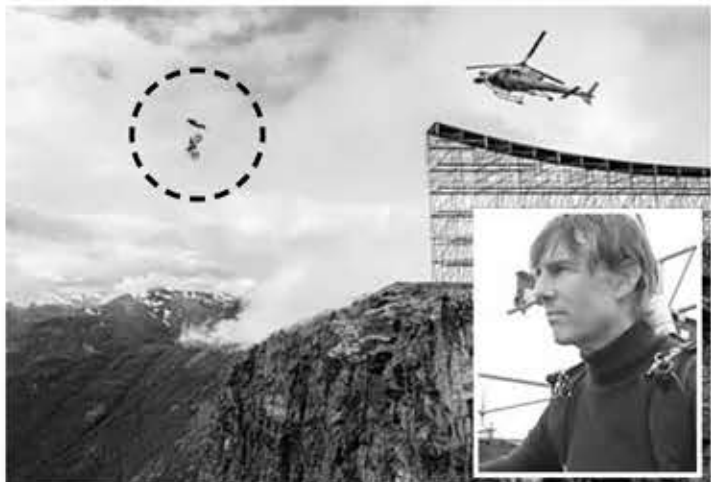
▲ '미션 임파서블 7' 오토바이 낙하 장면(왼쪽). 우측 작은 사진은 촬영전 준비 중인 톰 크루즈.

는 '미션 임파서블 7'에서 가장 위험한 오토바이 낙하신을 첫날 촬영했다. 톰 크루즈가 대자연의 풍광이 돋보이는 노르웨이 절벽에서 오토바이를 탄 채 뛰어내린 후 낙하산을 펼치고 땅에 착륙하는 아찔한 장면이다.