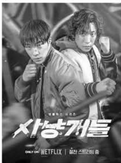
▲ 넷플릭스 드라마 '사냥개들' 포스터.

이버웹툰에서 85화 분량 연재한 동명의 웹툰을 원작으로 하고 있다. 원작은 긴장감 넘치는 스토리와 화려한 액션을 더해 마니아층의 호평을 받았다. 네이버웹툰 글로벌 플랫폼을 통해 영어로도 서비스 중이다.