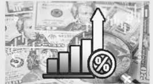
▲ 올 연말까지 더 많은 금리 인상이 있을 전망이다.

제롬 파월 연방준비제도(Fed) 의장이 "인플레이션을 낮추기 위해 더 많은 금리 인상이 있을 것"이라고 말했다.