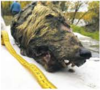
▲ 2019년 러시아 시베리아에서 발견된 4만 년 된 늑대머리.

영구동토층이 녹아내리면서 생기는 현상은 한 두가지가 아닌데 대중적으로 잘 알려진 것은 수만 년 간 얼어붙어 있던 동물이 발견되는 것이다. 과거 시베리아 영구동토층에서 약 1만 4,000년 된 멸종된 털코뿔소와 4만 년 된 늑대 머리 등이 발굴된 바 있다. 그러나 가장 큰 문제는 깊은 땅 속에 묻혀 있는 치명적인 병원균이 지표로 방출될 가능성이 있다.