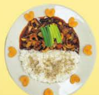
컵밥(오징어, 불고기, 치킨, 김치)

김치, 깍두기, 나박김치 맛은 어디서도 비교할 수 없는 맛을 자부합니다. *