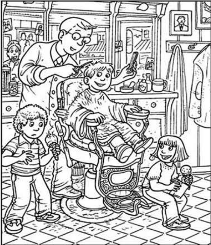
◎ 위의 그림에 숨어있는 아래 그림을 찾으며 영어 단어도 익혀 보세요. (해답은 P56에 있습니다)